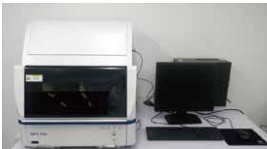
蛍光X線膜厚測定器