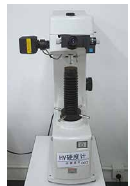
ビッカース硬度測定試験機