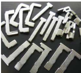
銅ニッケルめっき