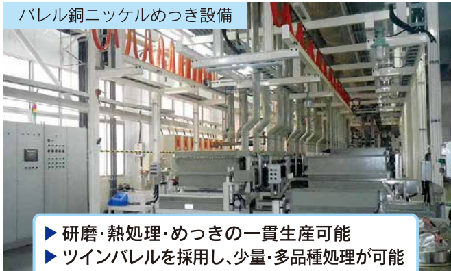
バレル銅ニッケルめっき設備